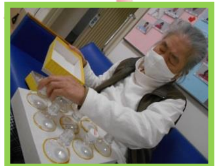
コロナに負けない体づくり