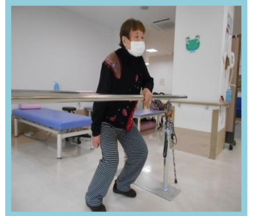
体操・トレーニング・指先の運動