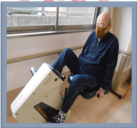
しっかりと体を動かしアッフ♪アッフ♪